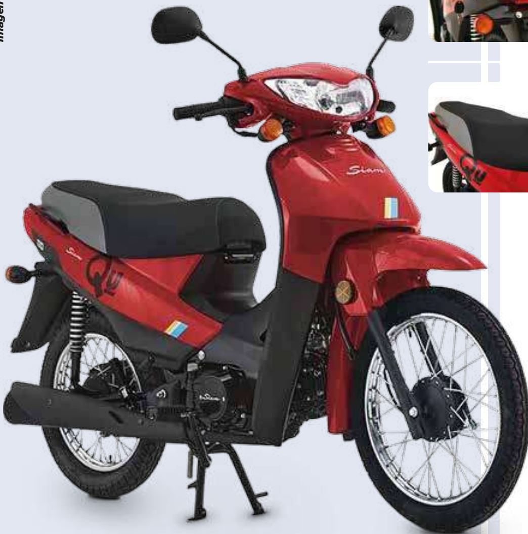
Imagen a modo ilustrativo.